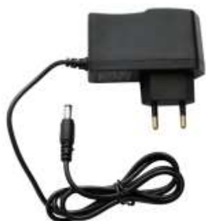
Fig. 1: Adattatore di alimentazione UE