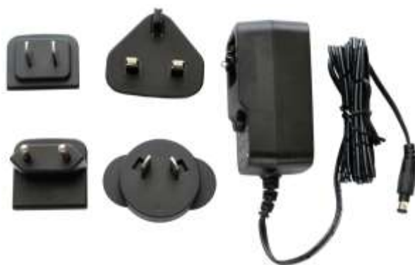
Fig. 2: Adattatore di alimentazione universale