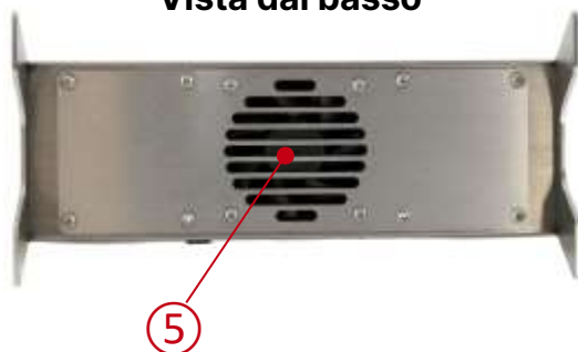
Vista dal basso