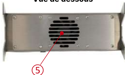
Vue de dessous