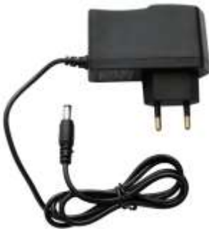
Fig. 1: EU-strømadapter