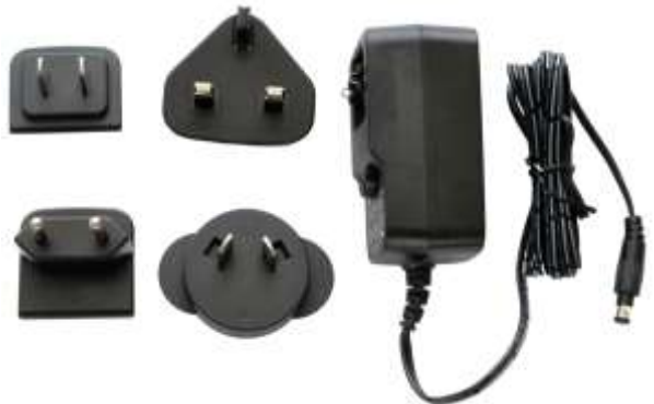
Fig. 2: Universell strømadapter